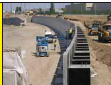
Panneaux à contreforts